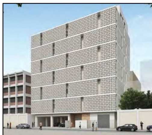
カイロ大学小児病院 内科系外来診療施設 完成予想図

今回の新設工事は、中東・北アフリカをはじめとする世界の過密化した都市において効率的で環境に配慮した圧入工法の優位性と有用性を証明し、その認知度を高める機会となります。