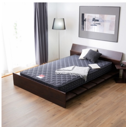
J-rest ベーシック スタンダード/プレミアムハード