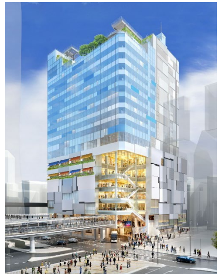
12月5日に開業予定の「渋谷フクラス」