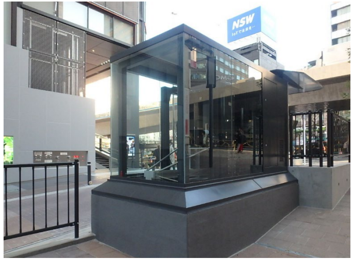
入出庫ブースは、周辺の建物と調和するデザインとした