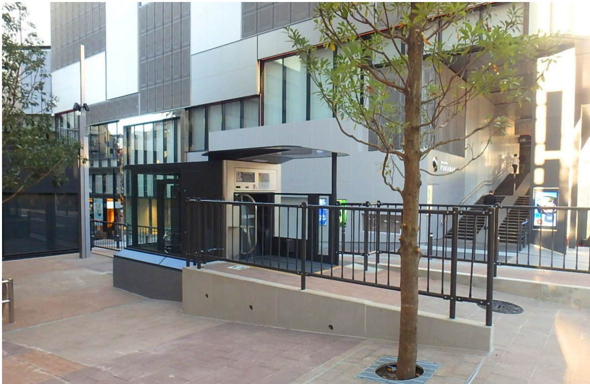
「渋谷フクラス」に隣接して設置された「エコサイクル」

「地上に文化を、地下に機能を」を製品コンセプトとする「エコサイクル」は、本案件が全国で22箇所、55基目の設置となり、首都圏では15箇所、40基目の設置となります。また現在、神奈川県川崎市でも2基の設置が進んでおり、2020年4月にオープン予定です。