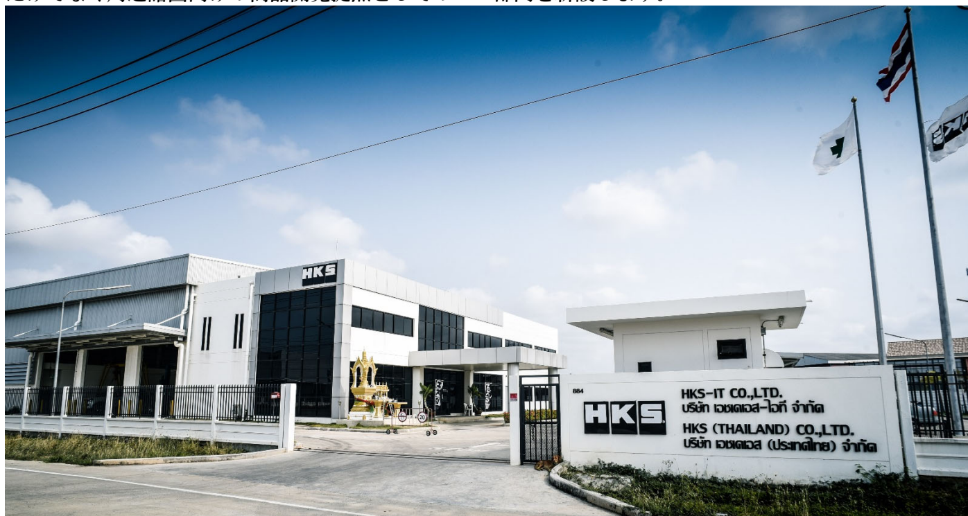
タイ国にある HKS 海外拠点：HKS-IT CO., LTD.（マフラー製造工場）HKS (THAILAND) CO., LTD.（販売会社）