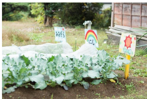
【保育園の畑の様子】

JPホールディングスグループでは、今後も様々な食育活動を通じて「食べることの楽しさ」をこどもたちに提供できるよう努めてまいります。