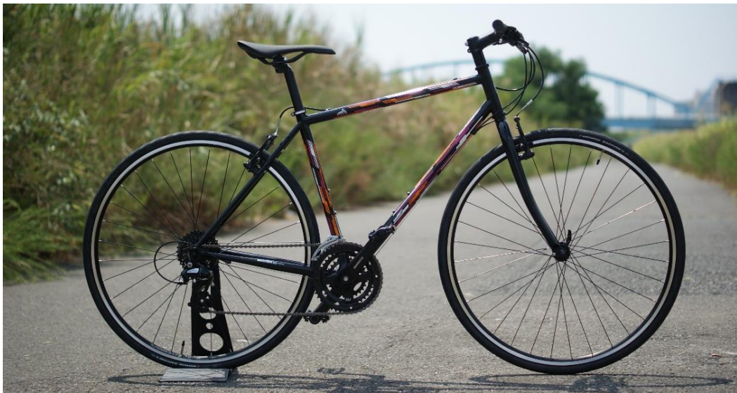
neon circuit（ネオンサーキット）

近畿大学文芸学部（大阪府東大阪市）と自転車販売店を展開する「サイクルショップカンザキ」（大阪府大阪市）は、文芸学部文化デザイン学科の学生がカラーリングデザインを行った産学連携開発のオリジナル自転車「neon circuit」（ネオンサーキット）を令和2年（2020年）9月1日（火）に発売します。