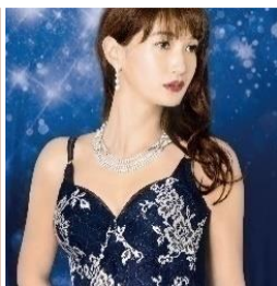
デコルテ リュミエス シリーズ