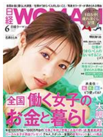
日経 WOMAN 2021 年 6 月号

MRK ホールディングスは、今後も内外共に、一人でも多くの女性をサポートし、女性を幸せにする企業として努めて参ります。