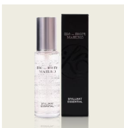
me_more MARUKO シリーズ