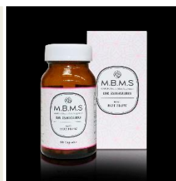
健康食品及びサプリメント