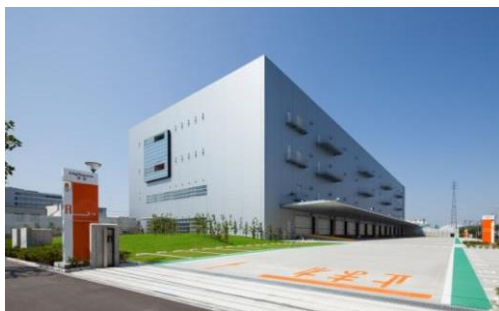
1 ロジスクエア草加 2013 年 6 月竣工