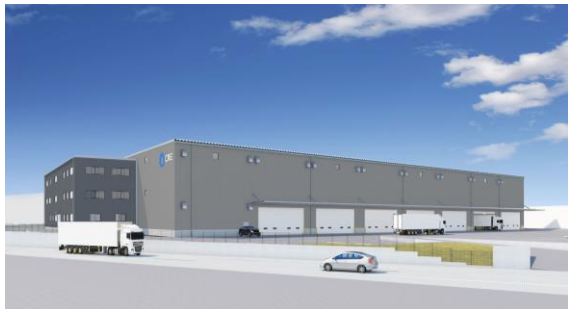
34 ロジスクエア掛川 2024年1月竣工予定