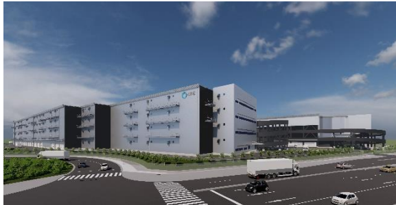
29 ロジスクエアふじみ野 A 2024年1月竣工予定