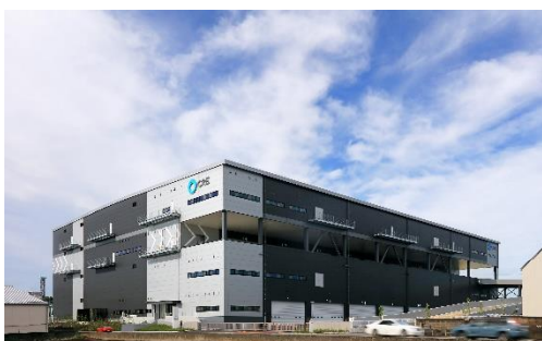
17 ロジスクエア三芳 2020 年 6 月竣工