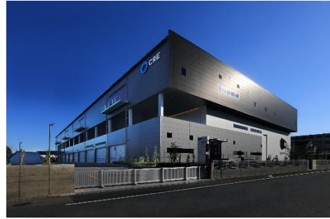
22 ロジスクエア白井 2022 年 12 月竣工