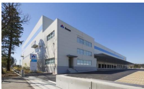
3 ロジスクエア日高 2015 年 3 月竣工