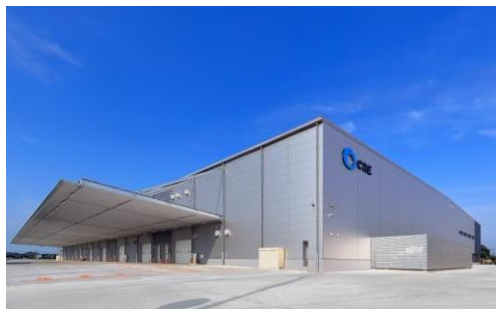
5 ロジスクエア羽生 2016 年 7 月竣工