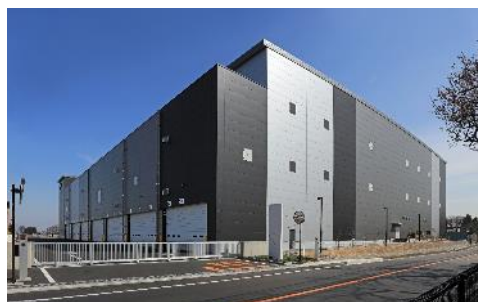
20 ロジスクエア三芳Ⅱ 2021 年 3 月竣工