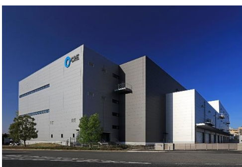
14 ロジスクエア上尾 2019 年 4 月竣工