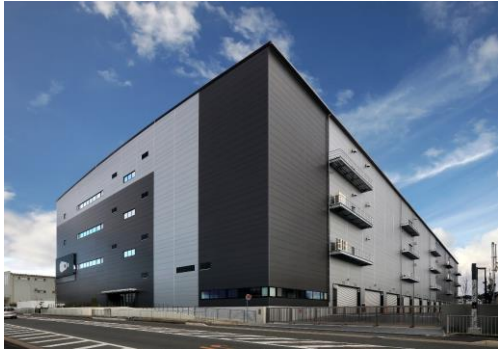
23 ロジスクエア枚方 2023 年 1 月竣工