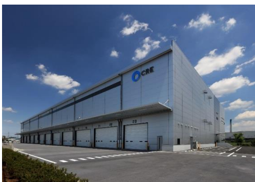
15 ロジスクエア川越Ⅱ 2019 年 6 月竣工