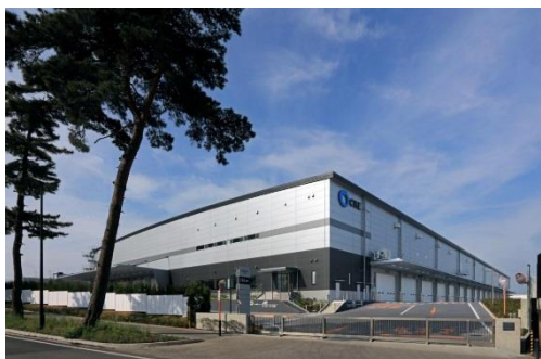
9 ロジスクエア守谷 2017 年 5 月竣工