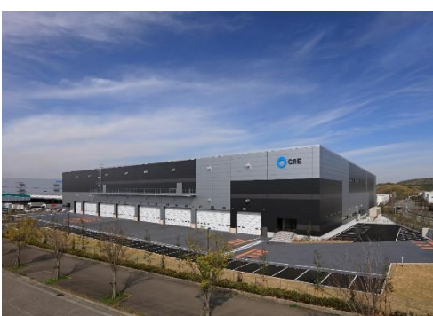
16 ロジスクエア神戸西 2020 年 4 月竣工