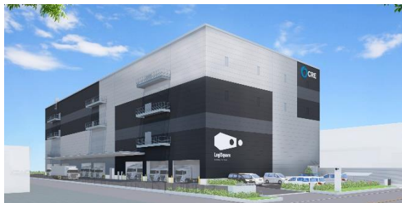
25 ロジスクエア松戸 2023年5月竣工予定