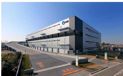
7 ロジスクエア浦和美園 2017 年 4 月竣工