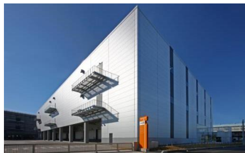
2 ロジスクエア八潮 2014 年 1 月竣工