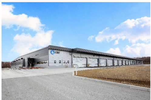
10 ロジスクエア千歳 2017 年 12 月竣工