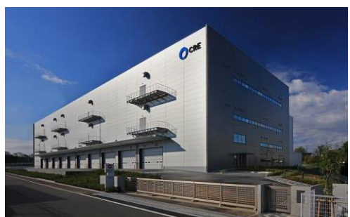
8 ロジスクエア新座 2017 年 4 月竣工