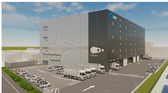
24 ロジスクエア厚木Ⅰ 2023年3月竣工予定