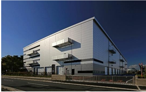
21 ロジスクエア伊丹 2022 年 11 月竣工