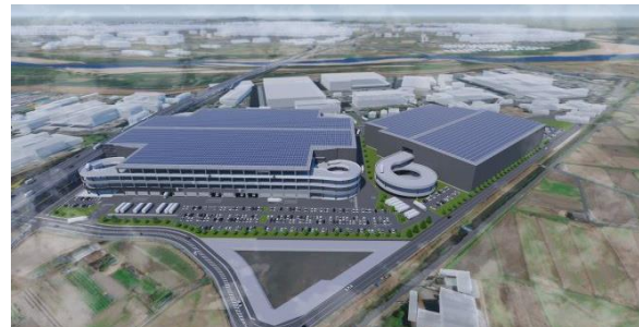
32 ロジスクエア京田辺 A 2025年2月竣工予定