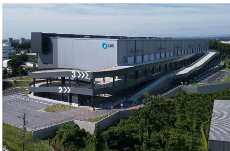
18 ロジスクエア狭山日高 2020 年 6 月竣工