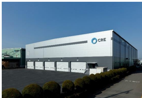
12 ロジスクエア川越 2018 年 2 月竣工