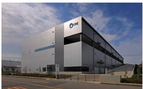
4 ロジスクエア久喜 2016 年 6 月竣工