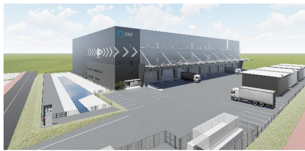
27 ロジスクエア福岡小郡 2024年2月竣工予定