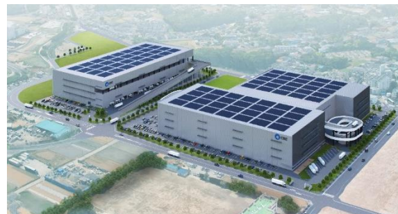
35 ロジスクエア朝霞 A 2026年竣工予定