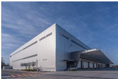
11 ロジスクエア鳥栖 2018 年 2 月竣工