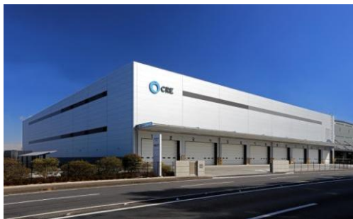
6 ロジスクエア久喜Ⅱ 2017 年 2 月竣工