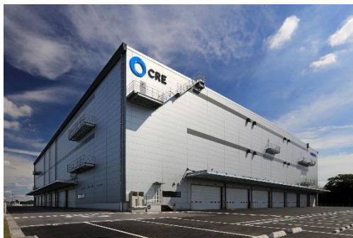
13 ロジスクエア春日部 2018 年 6 月竣工