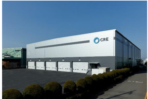
12 ロジスクエア川越 2018 年 2 月竣工