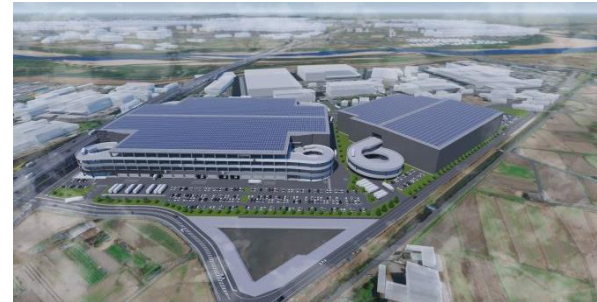
32 ロジスクエア京田辺 A 2025年2月竣工予定