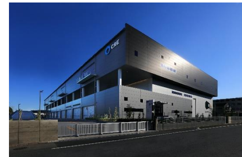
22 ロジスクエア白井 2022 年 12 月竣工