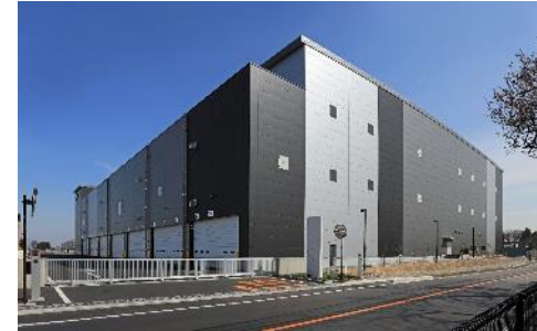
20 ロジスクエア三芳 II 2021 年 3 月竣工