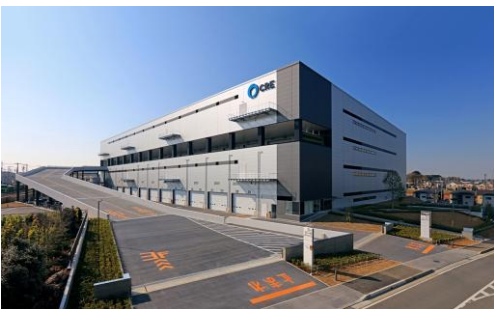
7 ロジスクエア浦和美園 2017年4月竣工