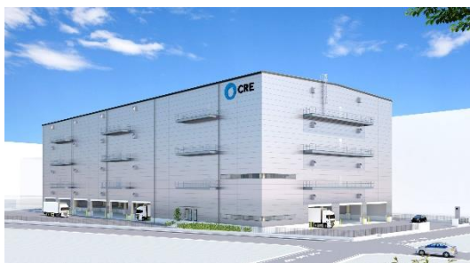
39 ロジスクエア草加Ⅱ 2024年8月竣工予定