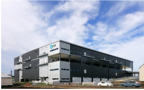
17 ロジスクエア三芳 2020 年 6 月竣工