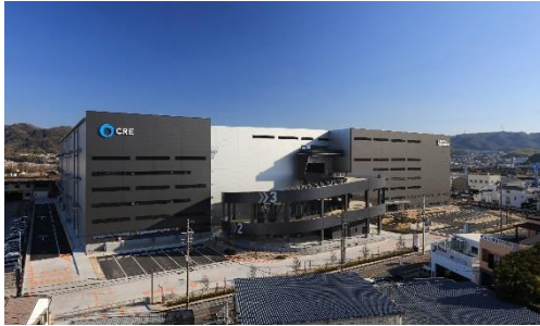
19 ロジスクエア大阪交野 2021 年 1 月竣工