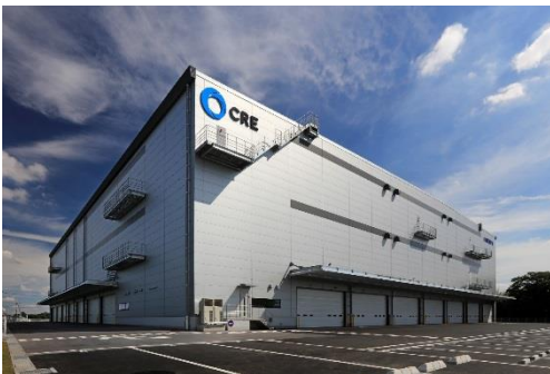
13 ロジスクエア春日部 2018 年 6 月竣工