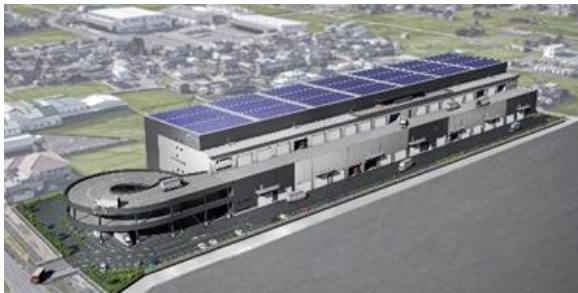
26 ロジスクエア宮 2023年9月竣工予定