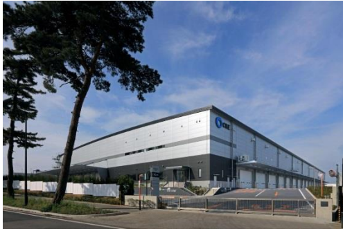
9 ロジスクエア守谷 2017 年 5 月竣工