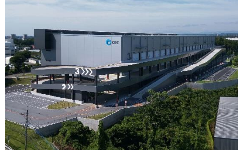
18 ロジスクエア狭山日高 2020 年 6 月竣工