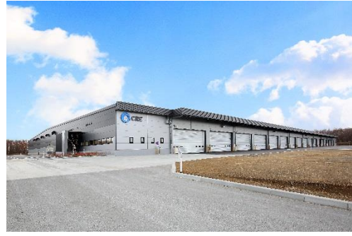
10 ロジスクエア千歳 2017 年 12 月竣工