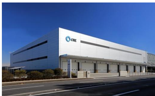
6 ロジスクエア久喜Ⅱ 2017年2月竣工