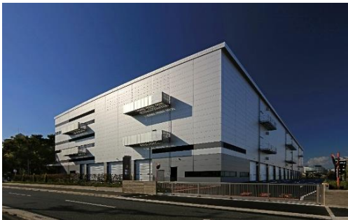
21 ロジスクエア伊丹 2022 年 11 月竣工