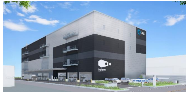
25 ロジスクエア松戸 2023年5月竣工予定