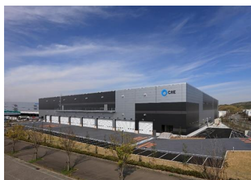
16 ロジスクエア神戸西 2020 年 4 月竣工