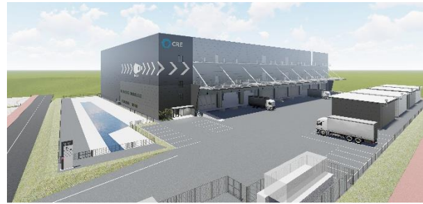
27 ロジスクエア福岡小郡 2024年2月竣工予定