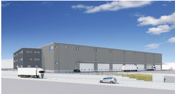
34 ロジスクエア掛川 2024年1月竣工予定