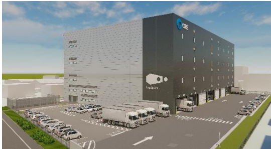
24 ロジスクエア厚木Ⅰ 2023年3月竣工予定