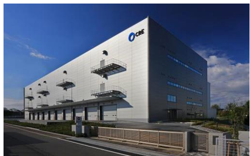
8 ロジスクエア新座 2017年4月竣工