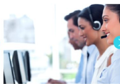
3. 通訳オペレーターに接続