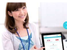
2. 店頭スタッフが言語を選択