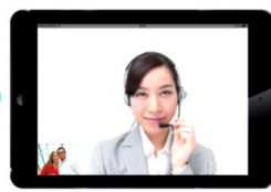
4. 映像を見ながら通訳開始