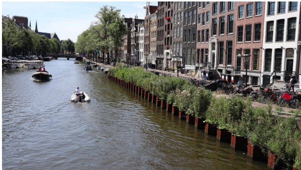
パイロット施工前