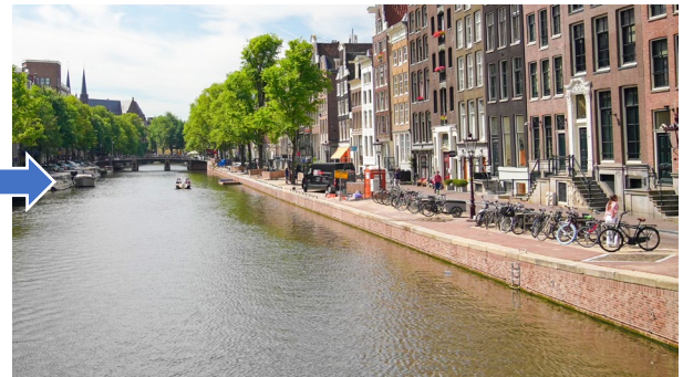
パイロット施工後