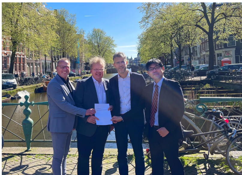
アムステルダム市担当者と G-Kracht B.V. でフレームワーク合意に調印

※2 過去のニュースリリースもご覧ください。 https://www.giken.com/ja/news/release/gkn23nw007ja/