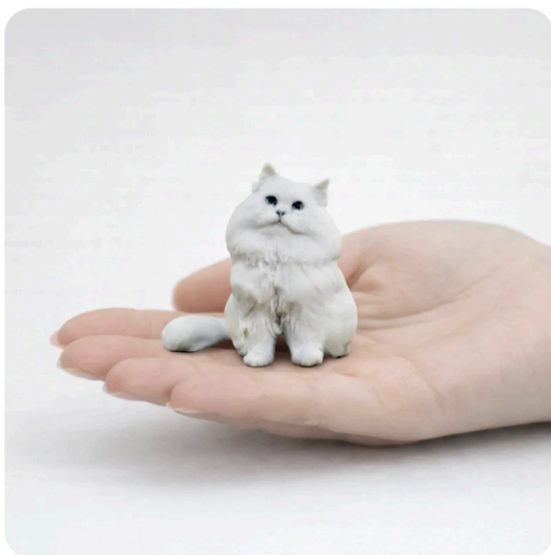
写真からつくる うちの子ペットフィギュア