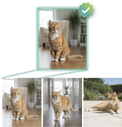
複数枚の写真の中から選定