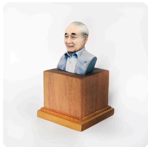
写真からつくる フォトAIフィギュア 胸像タイプ