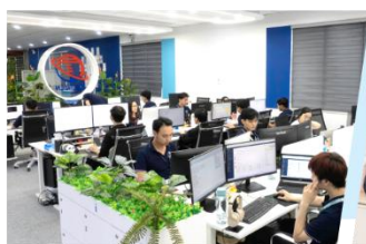
安定的・高品質な オフショア運営体制

ジャパン・クオリティかつAI・アジャイルにも対応できる高度なITシステム開発を 迅速に、柔軟に、オフショアならではのコストメリットで