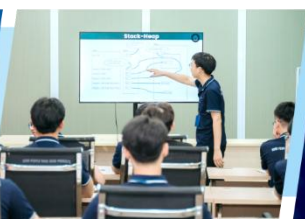
ジャパン・クオリティに対応する 高度IT人材育成