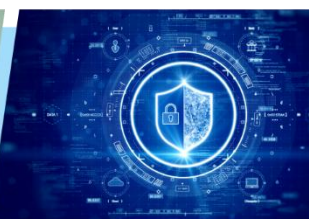
ジャパン・クオリティに対応する 強固なセキュリティ