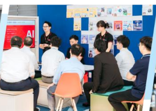
AIやアジャイルにも対応 高度なITシステム開発