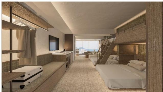
ミサワホームによる造作家具を用いたバンクベッドルーム