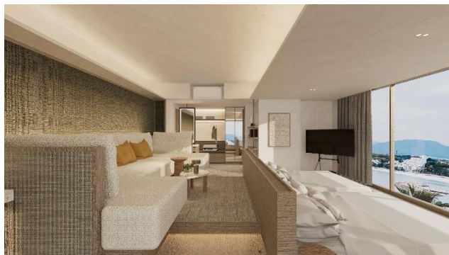
紀伊半島のパノラマを正面に望むツインルーム

※本リリース内、施設概要やイメージパースは現時点のものであり、変更となる場合がございます。