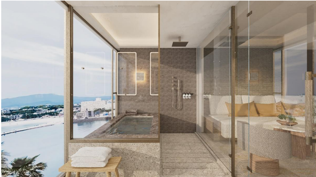
紀伊半島の絶景を望む「ビューバス」を備えた客室温泉の完成予想パース

本事業は、両社が培ってきた住まいづくりのノウハウと、地域開発における知見を融合させた共同プロジェクトです。地上6階建の建物に、全74室の客室、レストラン、サマルスパなどを備え、2028年1月の開業を予定しています。