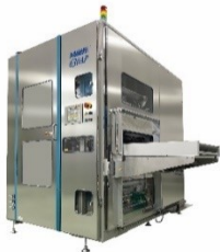
ドライフィルムオートカット ラミネータ Mach 630AP