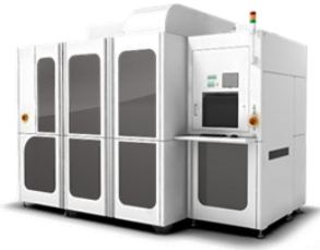
高解像・高精度投影露光装置 伯東 LS-320HR/LS-300EX