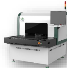
ガラスパネル・PKG 基板対応外観検査装置 CIMS Galaxy Cx series

また、各種装置以外にも、当社グループの様々なアイテムを展示いたします。フッ素イオン除去剤は、電子産業などで発生するフッ素を多く含む排水に関して、排水規制値以下にするためのケミカル剤です。受託分析サービスは、お客様の製品設計・開発に伴う各種材料の分析、調査、試験などが可能な受託サービスです。展示会場におきましては、実際の装置をご覧いただけると共に、具体的な製品情報や使用方法についてもブースで詳しくご説明いたします。