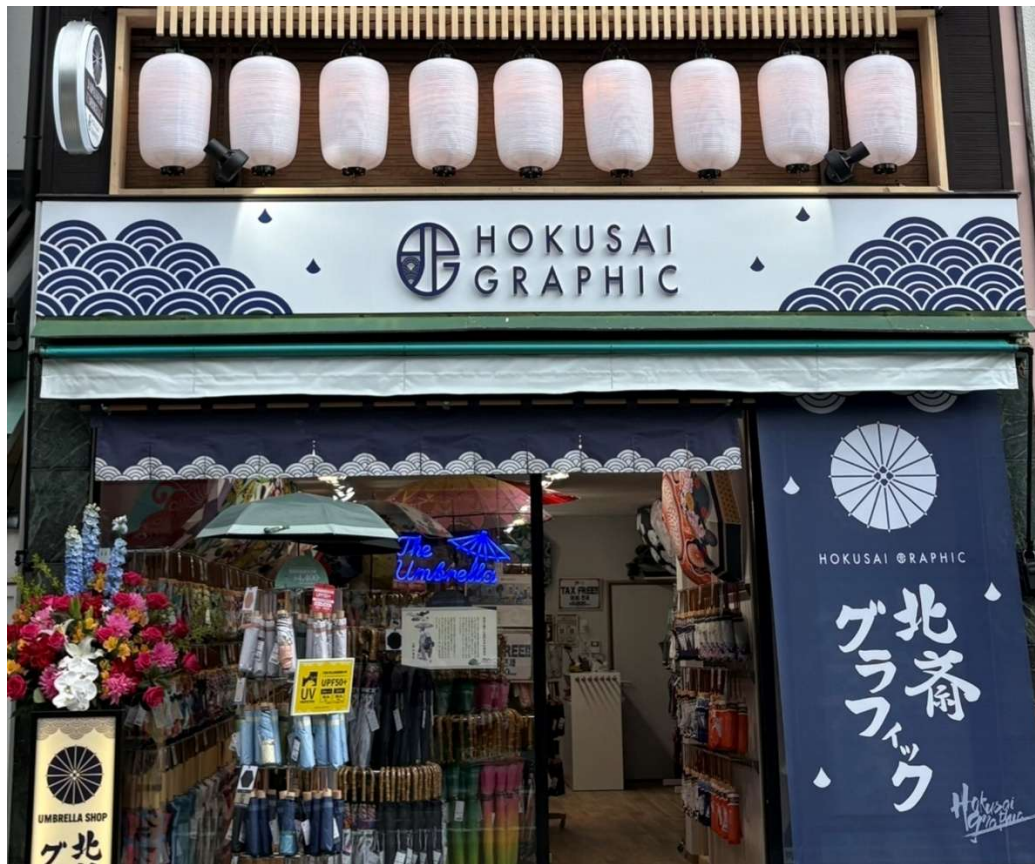
城崎温泉にオープンした和柄傘専門店「北斎グラフィック」の外観

本出店は、当社として城崎温泉エリア初出店となり、日本文化の魅力を国内外へ発信する新たな拠点として展開いたします。