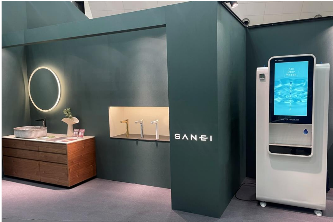
2月に実施した展示会の様子