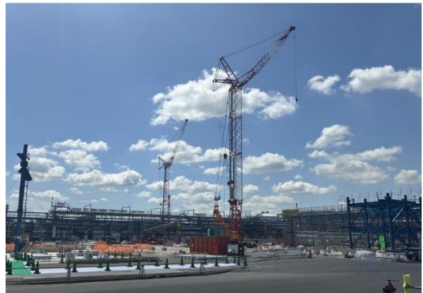
建設中の大型パイロット装置

当社はトヨタ自動車株式会社(以下「トヨタ」)と協業し、2027～2028年に全固体電池の実用化を目指しています。立柱式には、本装置の建設を担う千代田化工建設株式会社、トヨタなどの関係者が参列しました。