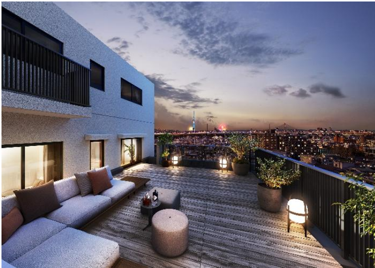
ルーフバルコニー完成予想図 (V1タイプ) (※7)