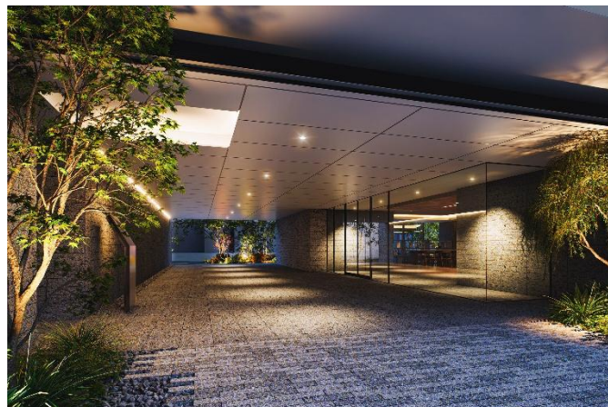
ピロティ完成予想図（※2）