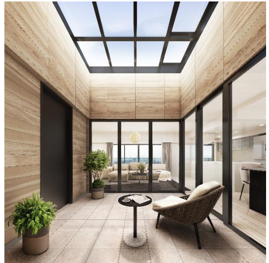
パティオ完成予想図 (Wタイプ) (※2)